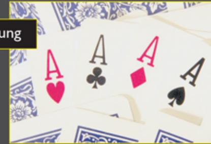
Karten vor der Bearbeitung